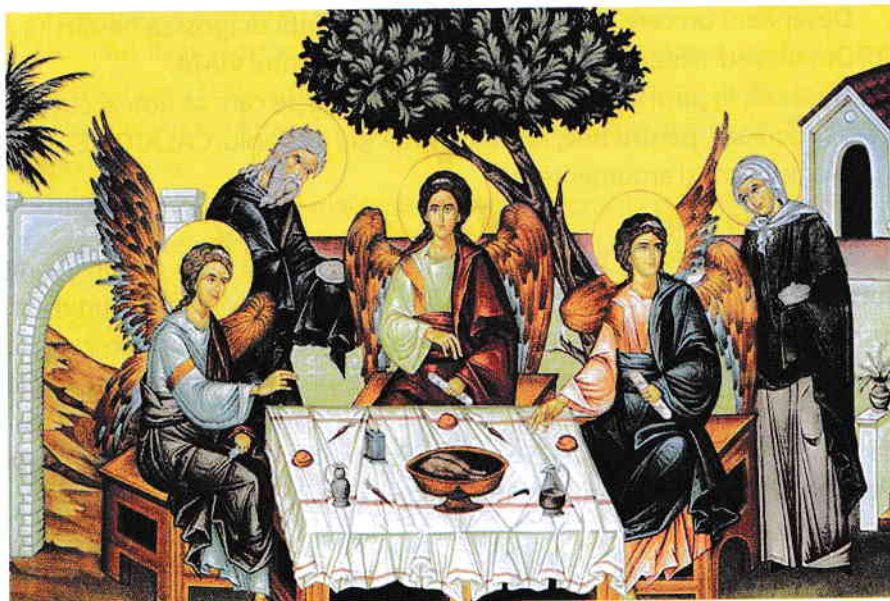
Icoană Sfânta Treime la Stejarul Mamvri