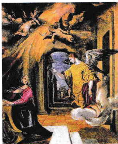
Buna Vestire, tablou de El Greco