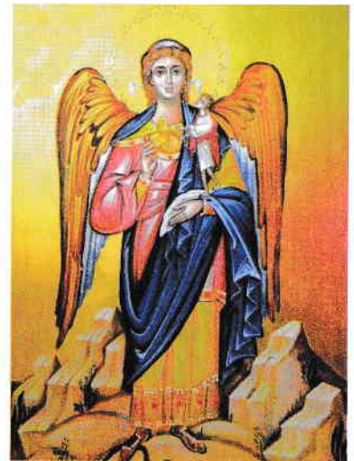
Icoană Îngerul Păzitor