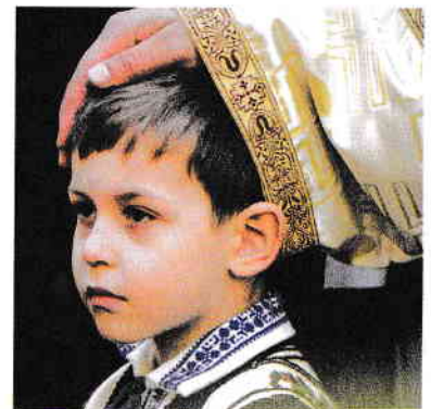
Purtare de grijă