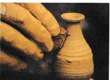
Omul, creator de frumos