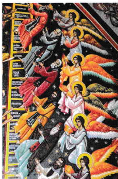
Frescă Scara virtuților