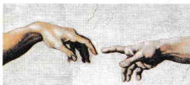
Michelangelo Buonarroti, Crearea lui Adam, frescă, detaliu