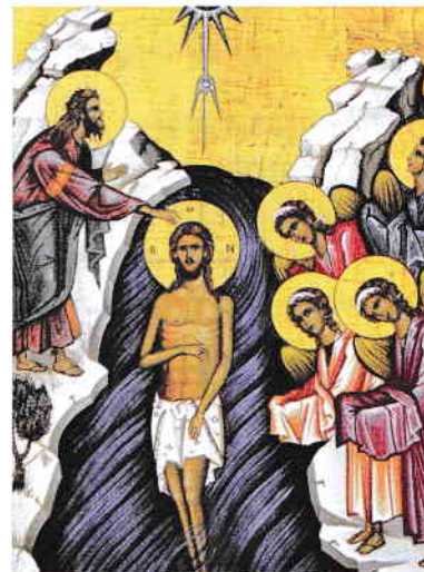
Icoană Botezul Domnului