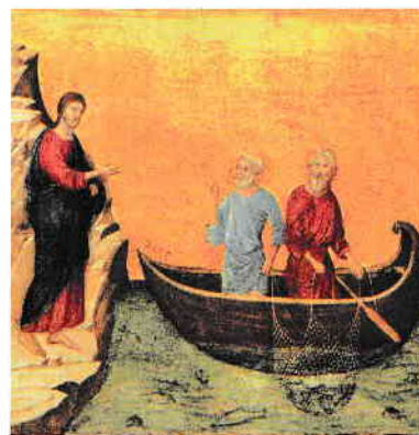
Chemarea Apostolilor Petru și Andrei, tablou de Duccio di Buoninsegna