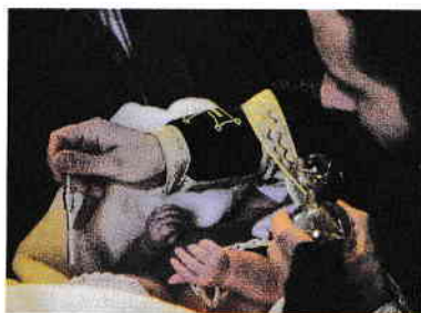
Sfânta Taină a Mirungerii