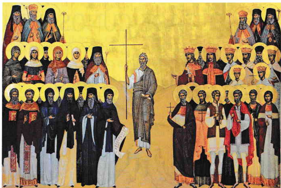
Icoană Soborul Sfinților români

Numele de om nu este dat sufletului sau trupului luate în mod separat, ci amândurora împreună, căci împreună ele au fost create după chipul lui Dumnezeu. (Sfântul Grigorie Palama)