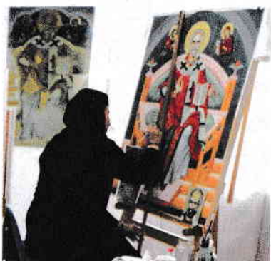
Sfinți și culoare