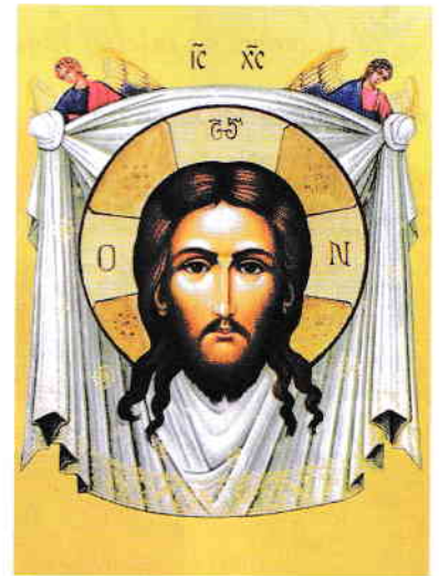
Icoană Sfânta Mahramă