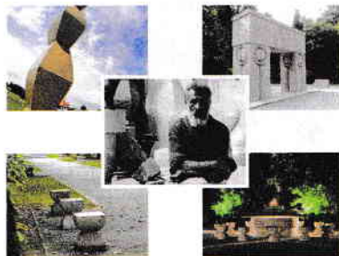
Brâncuși și operele sale